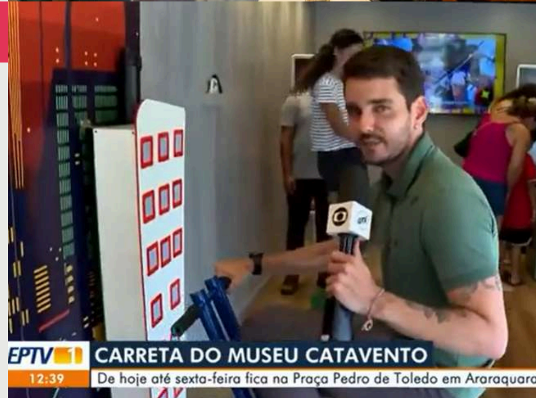
EPTV 1 CARRETA DO MUSEU CATAVENTO 12:39 De hoje até sexta-feira fica na Praça Pedro de Toledo em Araraquara

alcance total novos seguidores visualizações